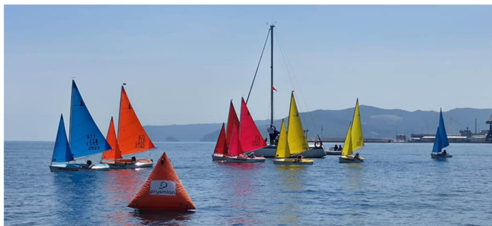
31/05/2025: regata Hansa 303 in singolo della LNI Savona

(*) La tappa di Savona vedrà la collaborazione della LNI Varazze e sarà valida anche come Campionato Zonale nel quale, a differenza degli altri fine settimana, le barche in singolo e quelle in doppio regateranno tutte insieme sia il sabato che la domenica.